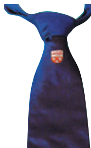
Club-Krawatte Aktion: Fr. 10.–