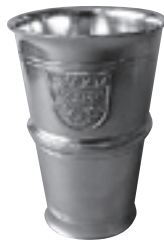
Zinnbecher Fr. 35.–