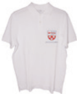
SCKM-Klub-T-Shirt Beste Qualität in verschiedenen Grössen Fr. 35.00