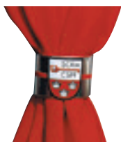
Krawattenring versilbert Aktionspreis Fr. 7.–