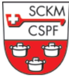
Stoffabzeichen 7,5x8cm Fr. 9.– Stoffabzeichen 5x5,5cm Fr. 7.–