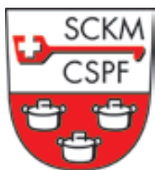
Autokleber Fr. 2.–